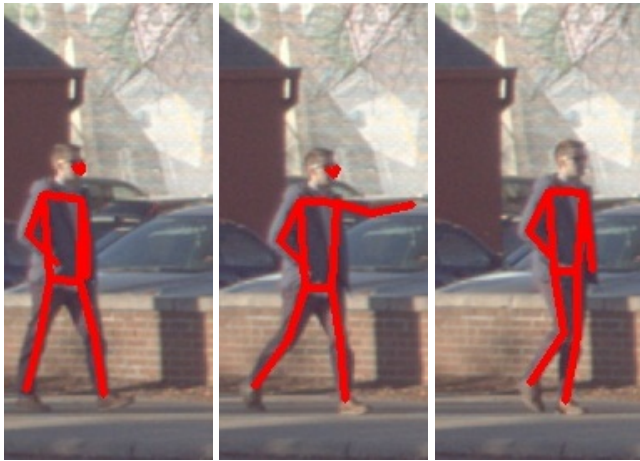
(a) t-1 フレーム (b) t フレーム (c) t+1 フレーム