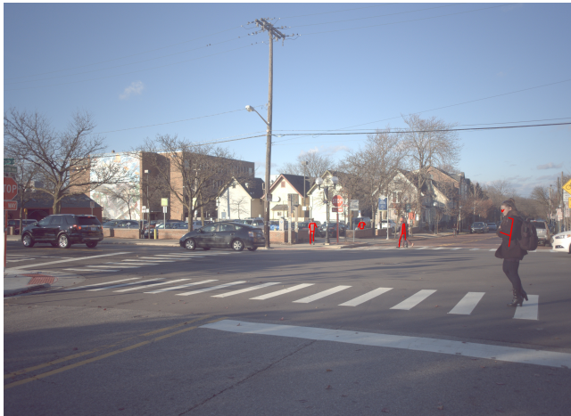
図 4: 提案手法によりアノテーション対象画像として選択した画像と、初期人物姿勢推定器による推定結果の例。